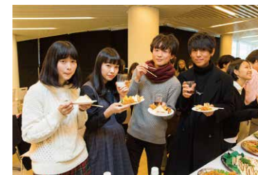
最終日のパーティでは、学年、教員関係なく 和気あいあいとした雰囲気。