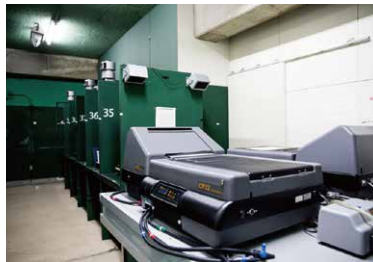
カラー暗室も完備。「中暗室」には、CP32というカラープリント用プロセッサが2台設置。