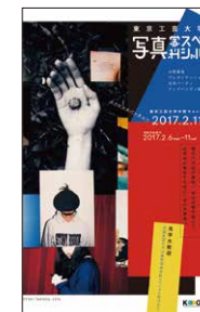
年に1度の大祭典 「写真学科スペシャル」