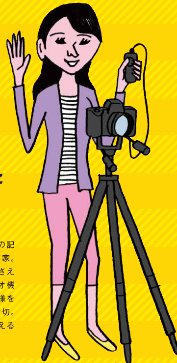
Photo Studio Photographer

企業の商品をPRするための写真をメインに撮影する写真家。料理やジュエリー、ファッションなど多様な分野があり、広告や雑誌などに使用される。いずれも被写体の魅力を引き出す視点や技術が必要。チャンスがあれば、憧れブランドやアーティストの撮影も夢ではない！