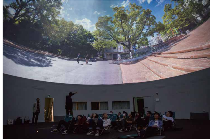
360°の映像を投影できる「VR実験ドーム」で、学生たちの新しい表現が生まれることに期待。