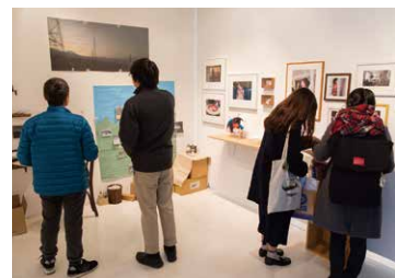
写真だけでなく、作品コンセプトに合わせて 地図も一緒に展示するものも。