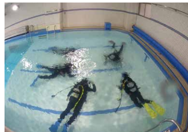
「水中撮影講座」の様子。世界で通用するダイビングの国際Cカード認定が受けられるようなカリキュラム。