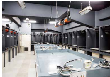
暗室は、共同で使用できる「大暗室」と、個室暗室が用意された「小暗室」があり、心置きなく現像作業ができる。