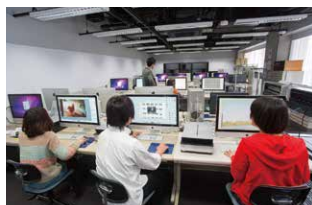
デジタル写真演習室

プロ仕様の機材がそろったスタジオが3つある中野 キャンパス。充実の機材と講師陣の丁寧なレクチャー で、卒業後も現場で役立つ技術が習得できます。