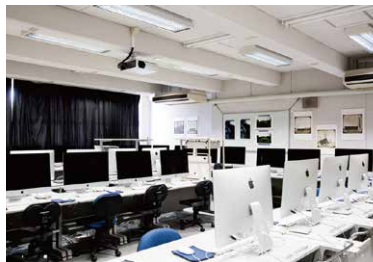
「デジタル実習室」では、画像編集ができるパソコンだけでなく、プリンターなどデジタル作品制作に必要な機材が完備。