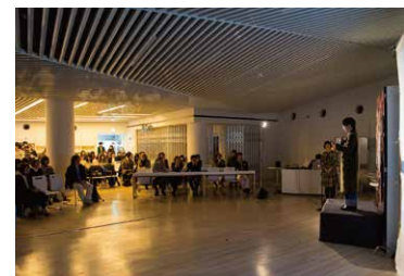
審査員賞に選ばれた学生は名前が呼ばれ、 仲間や審査員の前にあるステージにてプレゼン。

オープンキャンパス(芸術学部) 7月16日(日)、7月17日(月・祝)、8月13日(日) 10:00~16:00 ※予約不要 中野キャンパス 入試対策・留学生相談会 in 中野祭 10月8日(日) 10:00~16:00 中野キャンパス 進学相談会 in 工芸祭 10月28日(土)・29日(日) 10:00~16:00 厚木キャンパス スプリングスクール 2018年3月24日(土) 13:00~16:00 ※要予約 中野キャンパス