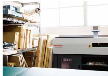
学科内には、ダミーブックなどをつくるための製本機も設置。あらゆる制作のための機材が用意されている。