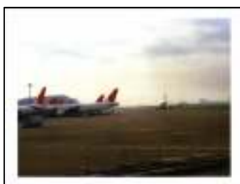
<写真集中面デザイン・表>