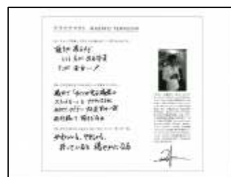
<写真集中面デザイン・裏>